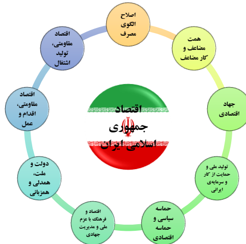
شکل (۱): منظومه‌ای از شعارهای هر ساله مقام معظم رهبری

و اشتغال. این‌ها را معظم له به عنوان شعارهای زودگذر مطرح نکرده‌اند؛ این‌ها موضوعاتی است که می‌تواند حرکت عمومی کشور را در زمینه‌ی اقتصاد ساماندهی کند و کشور را پیش ببرد.