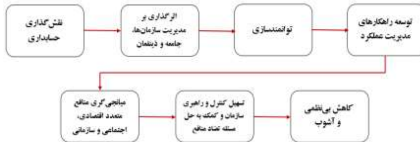
شکل (۲): روند اثرات نقش‌گذاری حسابداری در کاهش بی‌نظمی و آشوب

طرفین خواهد شد. بنابراین، در این راستا می‌توان ارتباط مسائل مورد اشاره را به شکل زیر ترسیم نمود.