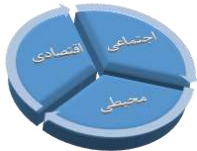
شکل (۳): ابعاد پایداری