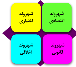
شکل ۲. ابعاد گزارشگری شهروند شرکتی

در ترویج ارزش‌های شهروندی را توسعه ببخشند. بنابراین، نقش اجتماعی بنگاه‌های اقتصادی در پاسخگویی به‌عنوان یک منفعت عمومی در جامعه، در قالب گزارشگری شهروند شرکتی تعریف می‌شود. فلیزوز و فین (۲۰۱۱: ۱۴۰۹) در یک دسته‌بندی، گزارشگری شهروند شرکتی را در قالب چهار بُعد زیر تفکیک می‌کند.