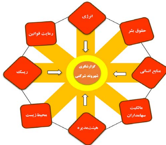
شکل ۴. الگوی نظری پژوهش

فرآیندهای تحلیل کیفی نسبت به تعیین ابعاد گزارشگری شهروند شرکتی اقدام شود. با عنایت به ابعاد شناسایی شده در بخش کیفی و تأیید ابعاد از طریق تحلیل دلفی، در قالب شکل (۴) چارچوب نظری پژوهش مشخص می‌شود.